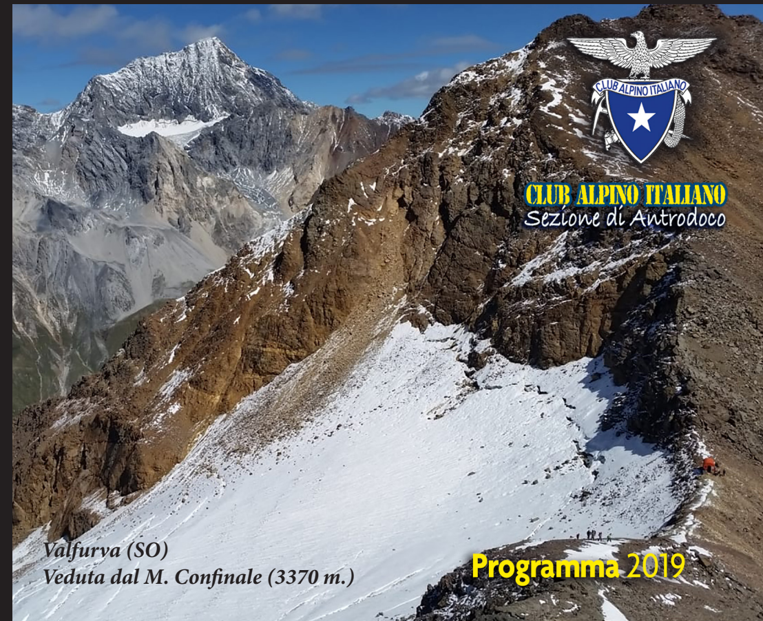
Valfurva (SO) Veduta dal M. Confinale (3370 m.)